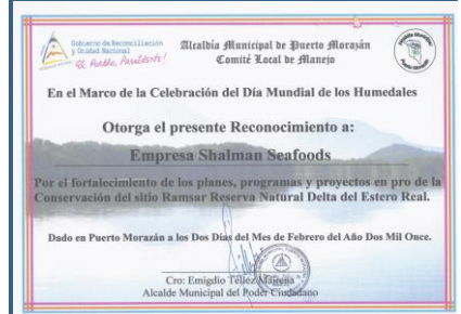
Reconocimiento entregado por la Alcaldía Municipal de Puerto Morazán