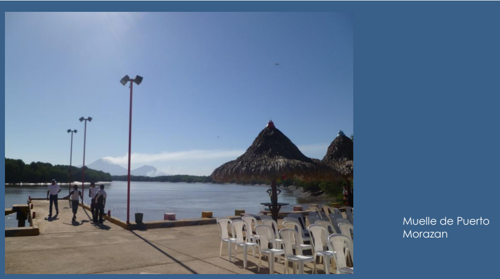
Muelle de Puerto Morazan